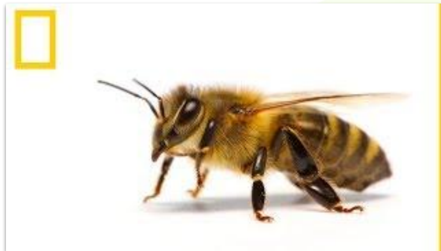
Βίντεο: Πώς ξέρουν οι μέλισσες ποια είναι η δουλειά τους; National Geographic

Συγκεκριμένοι ρόλοι και αρμοδιότητες που ασκούνται από τους εργαζόμενους. Διαφέρουν ανάλογα με τη θέση εργασίας και τη θέση και καθορίζουν τι αναμένεται από το άτομο και πώς συμβάλλει στην επιτυχία του οργανισμού. Είναι πολύ σημαντικό να καταλάβετε ότι όλοι οι ρόλοι προσφέρουν κάτι στο τραπέζι. Από τα καθήκοντα που εκτελεί ο νεοεισερχόμενος έως εκείνα που εκτελεί το αφεντικό, όλα είναι απαραίτητα για την ομαλή λειτουργία.