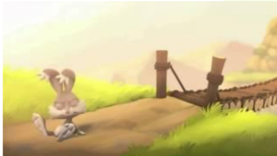
Video: Cortometraje “El Puente”.

Μπορεί να προκύψουν διαφωνίες, όπως σε κάθε άλλη κατάσταση στη ζωή. Αλλά μην το φοβάστε αυτό! Το σημαντικό είναι να έχετε τα εργαλεία για να ξέρετε πώς να τα χειριστείτε, όπως η διεκδικητικότητα, η ενεργητική ακρόαση, η ενσυναίσθηση και η ταπεινότητα. Οι καλά επιλυμένες συγκρούσεις μπορούν να οδηγήσουν σε πολύ ενδιαφέρουσες συμφωνίες.