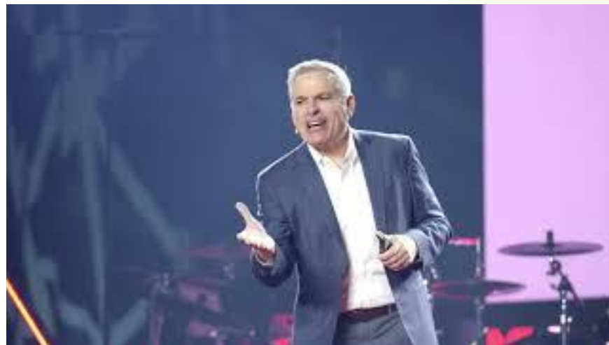
Βίντεο: Είσαι ένας ιδανικός συμπαίκτης; | Patrick Lencioni | TEDxUniversityofNevada.

Είναι φυσιολογικό να δυσκολεύεστε να ζητήσετε βοήθεια στην εργασία σας, είτε επειδή ντρέπεστε είτε επειδή φοβάστε ότι θα φανείτε ανίκανοι. Ζητώντας βοήθεια, μπορείτε να έχετε πρόσβαση στην εμπειρία και τις γνώσεις των άλλων και να μάθετε από αυτούς, να γίνετε πιο αποτελεσματικοί στην επίλυση προβλημάτων, πιο παραγωγικοί, να μειώσετε το άγχος και τον φόρτο εργασίας.