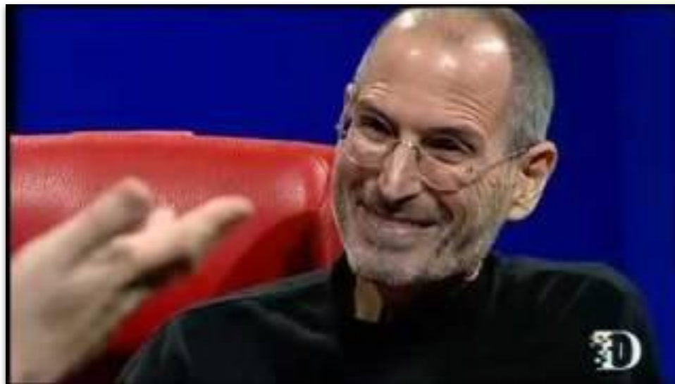
Βίντεο: Οργανωτική δομή από τον Steve Jobs

Ομάδες εργαζομένων που επικεντρώνονται σε συγκεκριμένα καθήκοντα και λειτουργίες. Αυτή η εργασία σε εξειδικευμένους τομείς συμβάλλει στη λειτουργία ολόκληρης της εταιρείας, με τα τμήματα να συνεργάζονται για την επίτευξη κοινών στόχων.