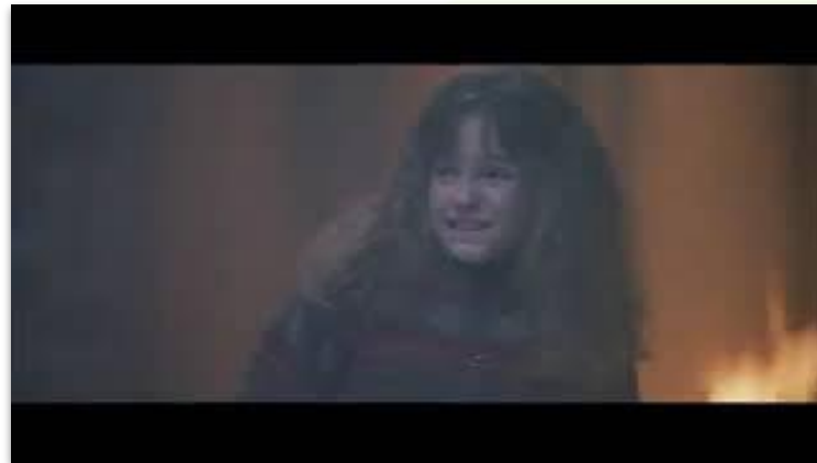
Βίντεο: Σκηνή από το βιβλίο Ο Χάρι Πότερ και η φιλοσοφική πέτρα, η παρτίδα σκακιού.

Youth & Empowerment: Εκπαίδευση των νέων για πρόσβαση στην αγορά εργασίας